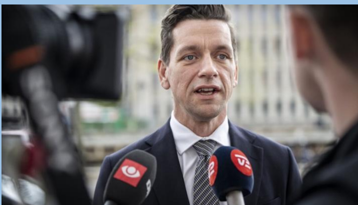
Udlændinge- og integrationsminister Kaare Dybvad Beck

Heldigvis er planen blevet opmærksom på den ufattelige diskrimination grønlandere bliver udsat for i Danmark. Gid det vil blive udmøntet i at vi her i landet får udvidet mulighed for at lære grønlandsk. Tænk, hvis vi virkelig kunne lære at forstå befolkningen på den store ø i Arktis. Der bor danske statsborgere, som andre nationer – og jeg tænker på mange andre end amerikanere, - finder inuit eksotiske; det er derimod sjældent at møde en dansker der er velvilligt nysgerrig efter at forstå.