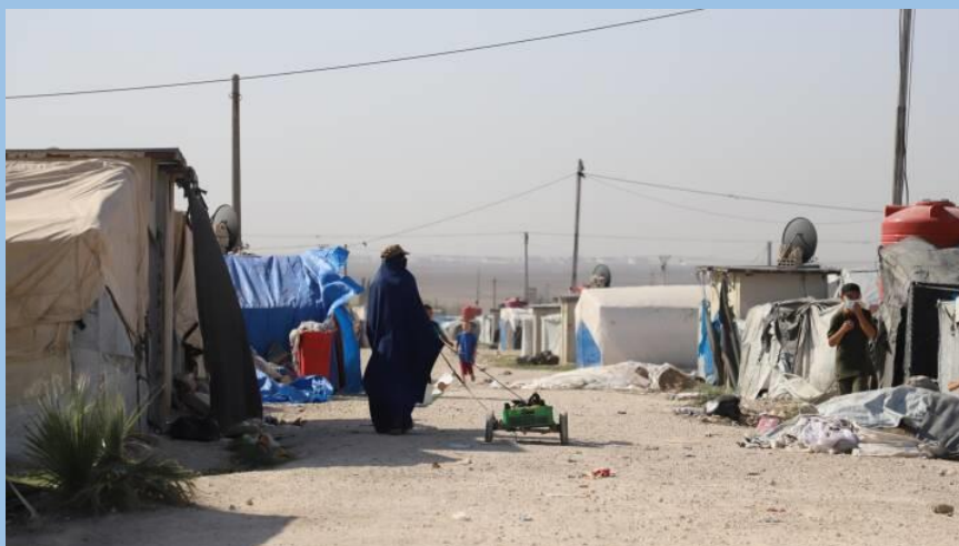
Syrisk fangelejr

Så kommer han endelig til det "forjættede land, Danmark", som han i årevis har glædet sig til – "lykkelige Danmark" – og bliver ikke alene adskilt fra sin mor, som blev fængslet, han skal opholde sig blandt ene fremmede mennesker, frem for et ophold sammen med sin danske familie.